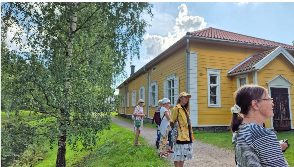
Rauman oppaat opastivat reitin Carpe diem -kohteisiin ja kertoivat Vanhan Rauman historiasta ja rakennuksista.