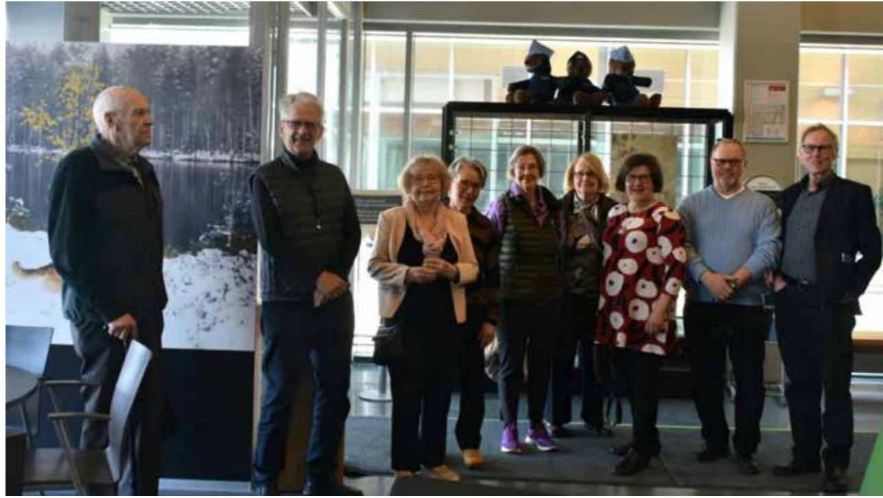
Tampereen Poliisimuseo kiinnosti seuran väkeä.