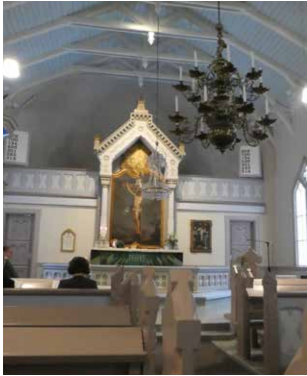
Köyliöläisten kaunis kotikirkko