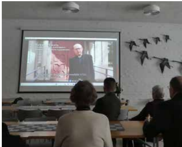
Köyliön kirkon esittelyvideo valmistui