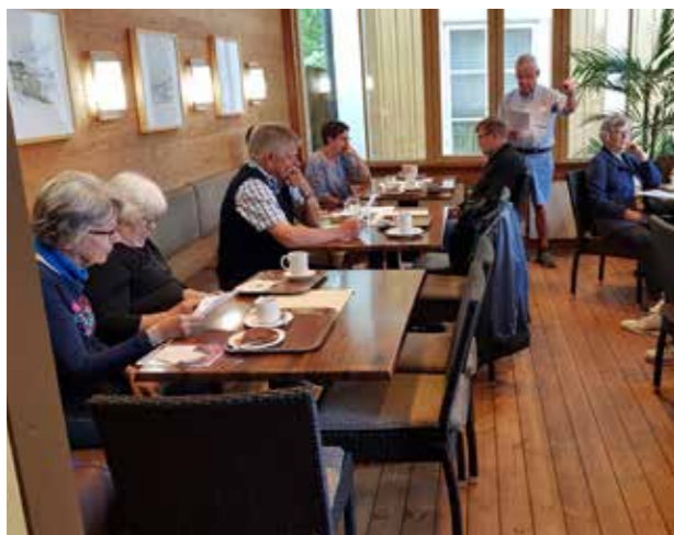
Raumalla tavattiin Kontion kahvilassa

7.5. Köyliön ystävät kokoontuivat Kokemäenjoen kulttuurimaisemassa Harjavallassa, ensin Uotilan tilalla klo 11.30 ja sitten Emil Cedercreutzin museossa klo 14-16. Osallistujia oli 19