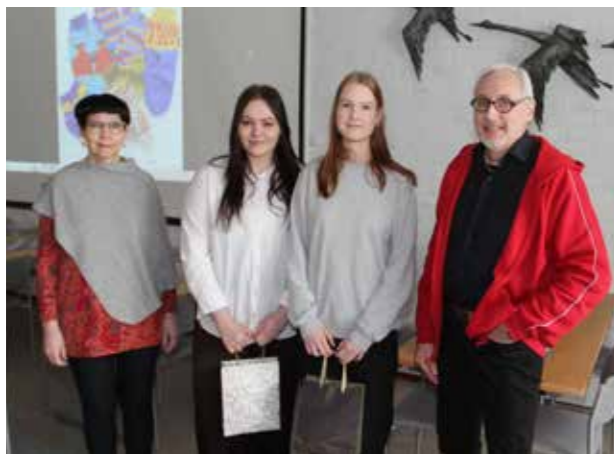
Legendat Live -hankkeen nuoret avustajat palkittiin elokuvalipuilla ja -eväillä.