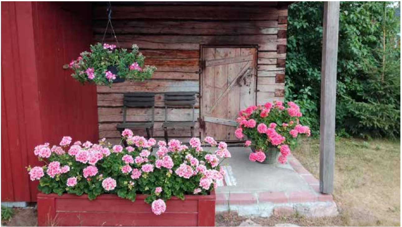
Helena Santalan kuvaama oman pihan ”Pelakuuparatiisi” oli Silmäniloa ohikulkijoille -kilpailun suosikki.