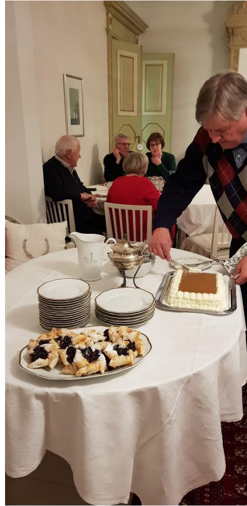
Joulutorttuja, täytekakkua ja kahvia