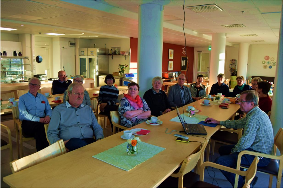
Pori, kuva vuodelta 2017