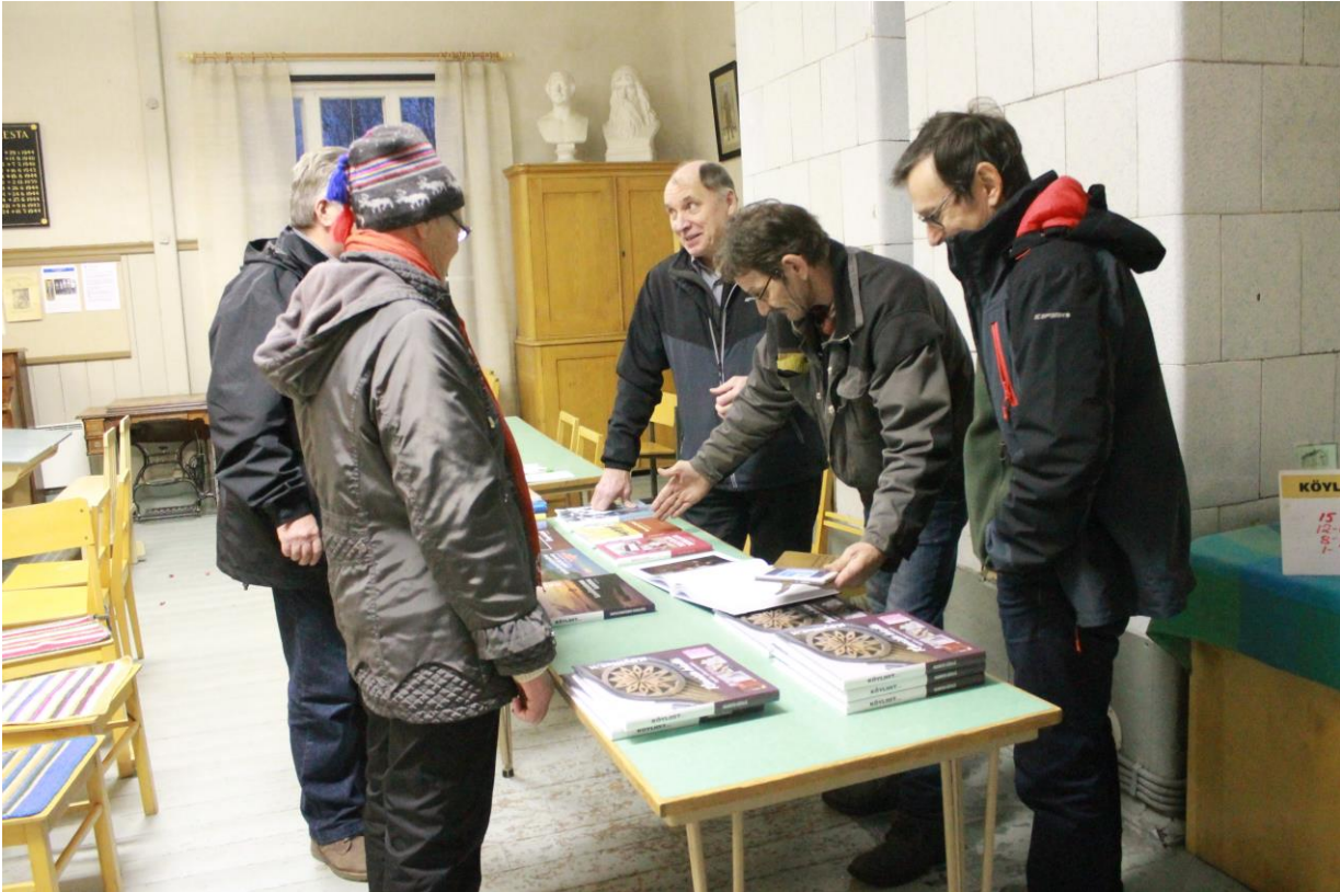
Kaunista-käsillä kirja julkistettiin Yttilän Museokoululla Köyliön Ystävät-jaosto

senet pitivät tiiviisti yhteyttä toisiinsa puhelimella ja sähköpostein. Tästä kuvaavana esimerkkinä on se, että jaoston puheenjohtaja sai vuoden aikana 426 sähköpostia joko jaoston jäseniltä tai Köyliöstä 15 -teokseen liittyen.