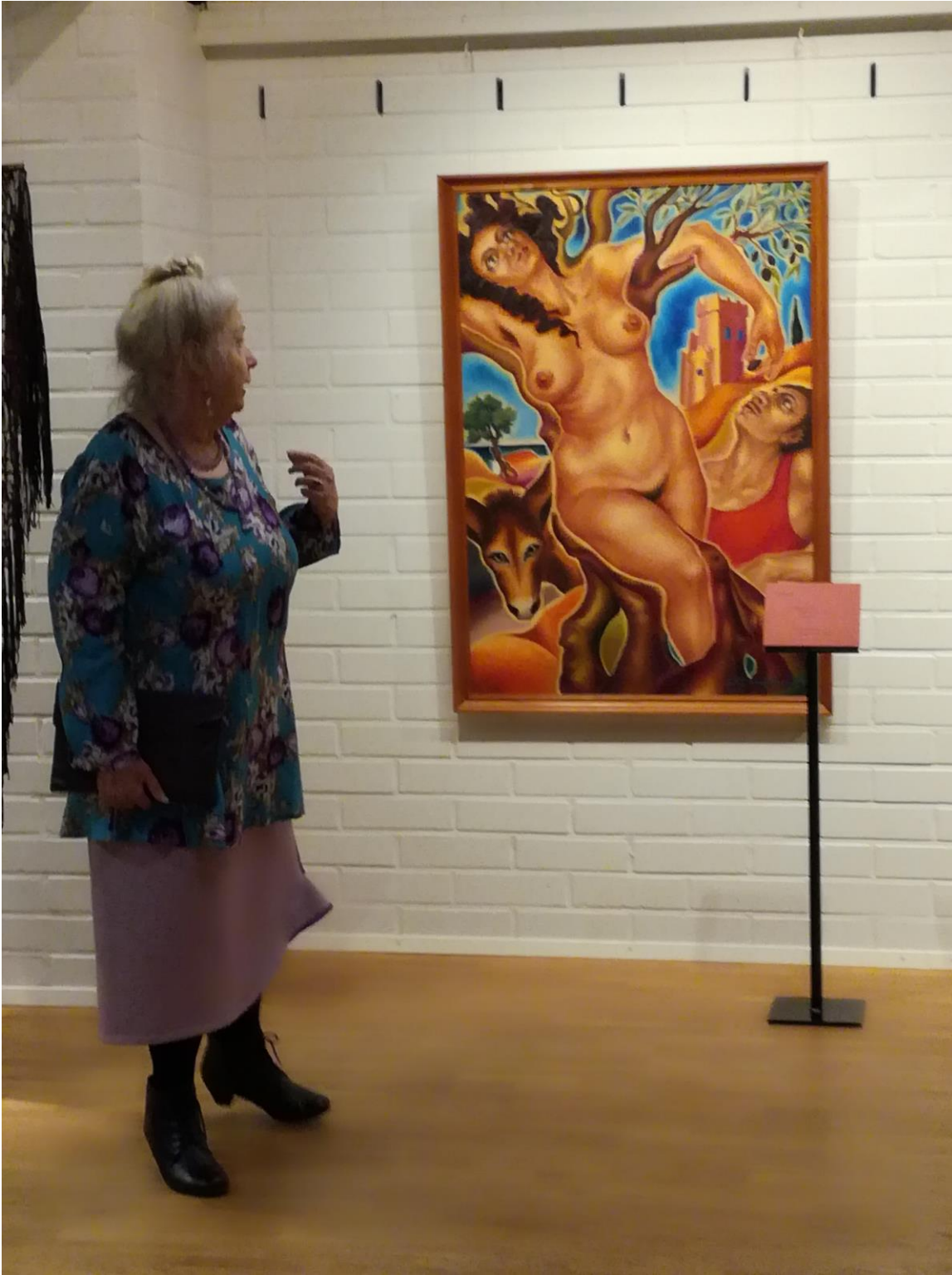
Köyliön lähialueet Harjavalta

Köyliön Ystävien 10-vuositapaamisen kunniaksi toteutettiin juhlakiertue, joka koostui ystävätapaamisista Köyliön ystäviä jokaisessa ystäväkaupungissa ja Köyliön lähialueella.