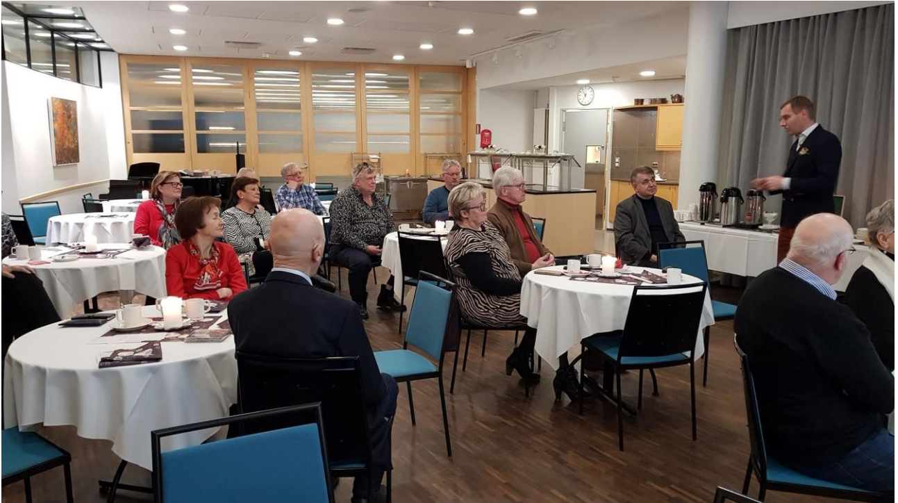
Luennon jälkeen syntyi vilkas keskustelu.