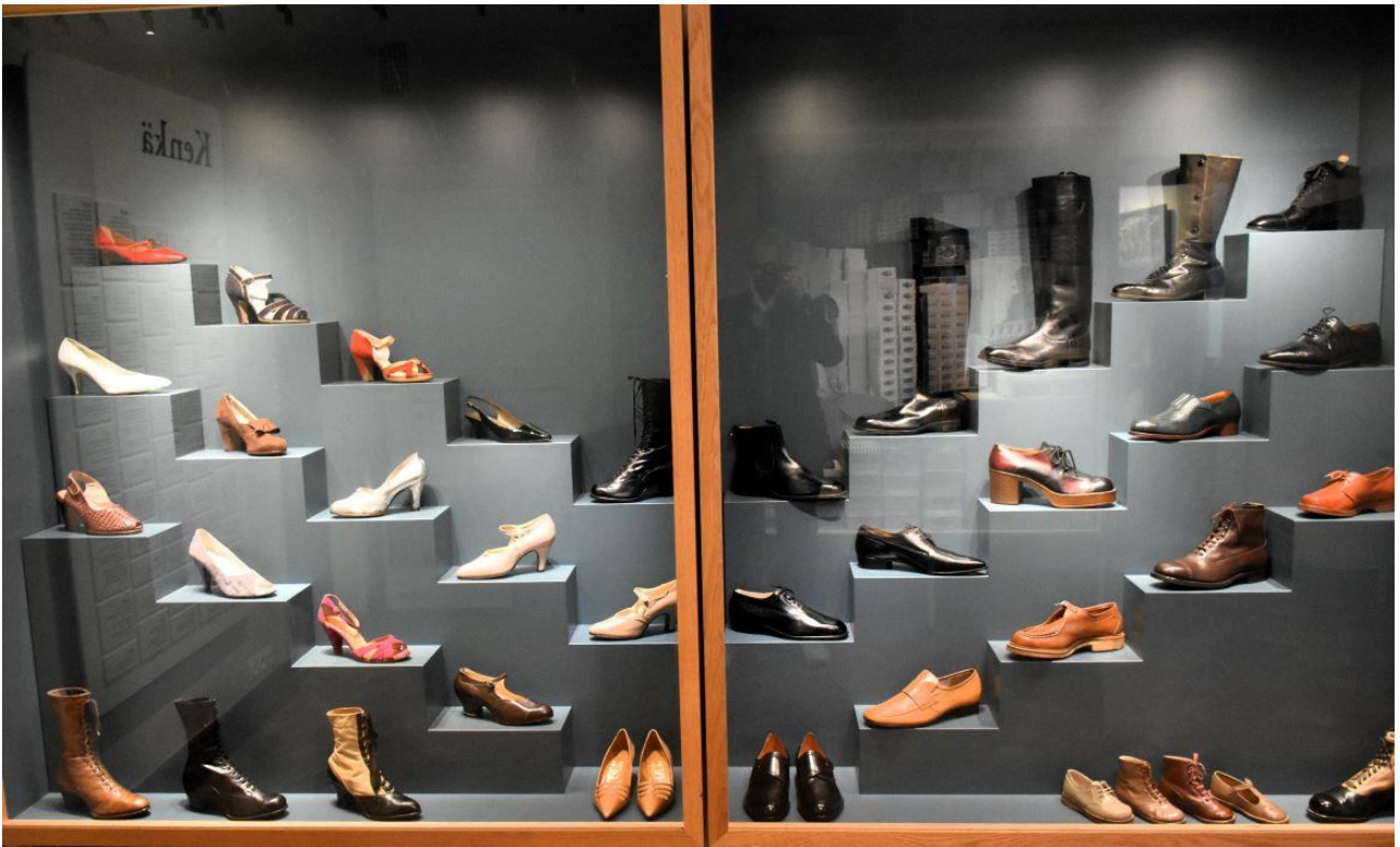
Aaltosen kenkätehtaiden tuotteita