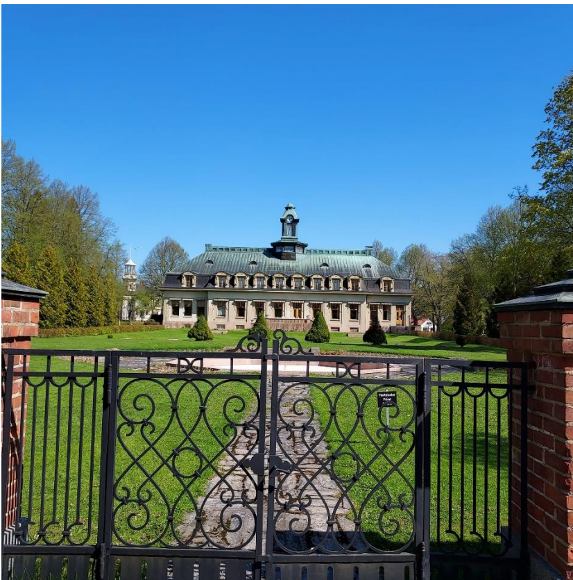
Ahlström yhtiön edelleen toiminnassa oleva päärakennus