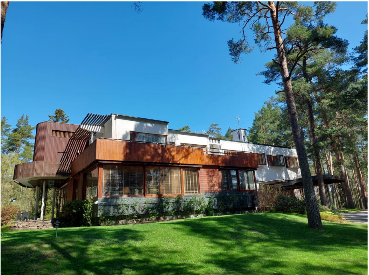
Villa Maire, suunnitellut Alvar Aalto