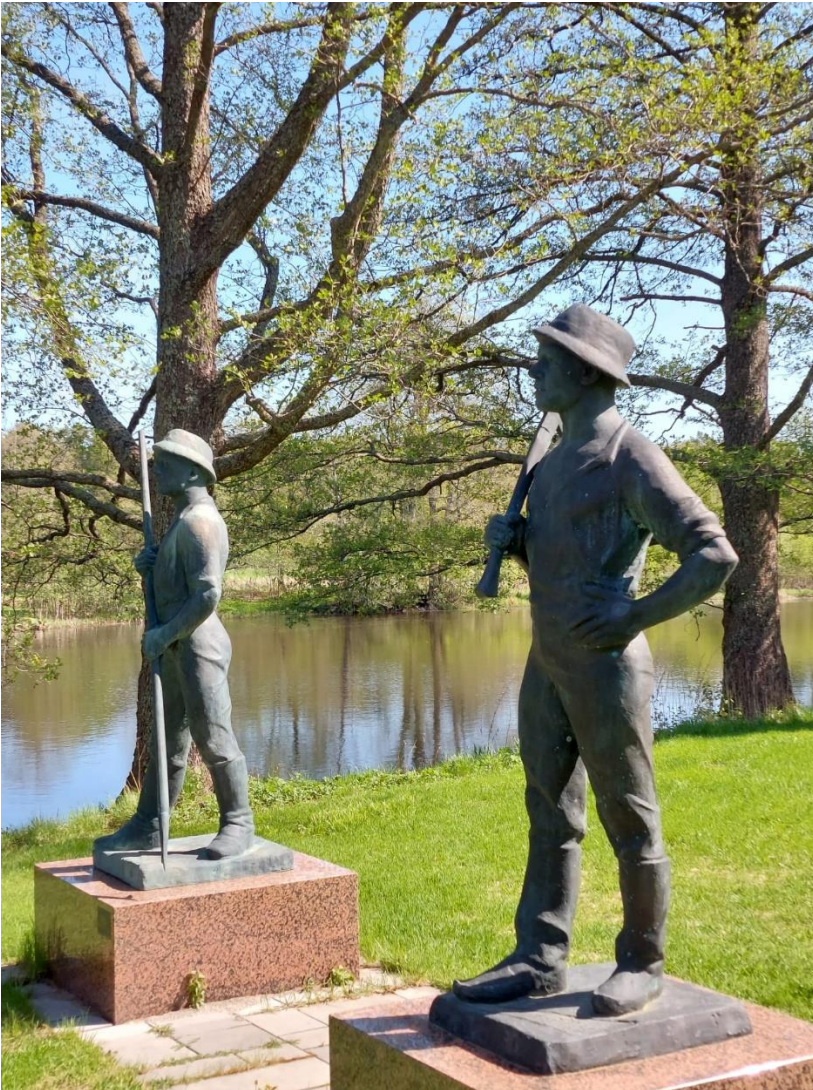
Emil Cedercreutzin veistokset