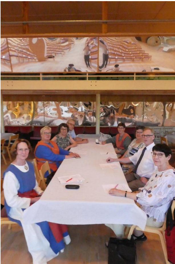
Köyliön ystävät-jaoston kokous Lallintalolla 3.7.2022 klo 16.15-17.