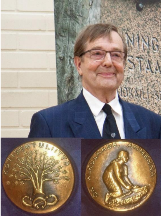
Kalevin kuva ei ole Kotiseutuliiton palkitsemistilaisuudesta vaan Köyliö-päiviltä.